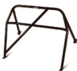
Skrūvējams nepilns roll cage vai bez drošības karkasa