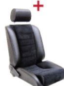
Sēdekļi ar regulējamu atzveltni