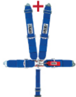
Sporta drošības jostas