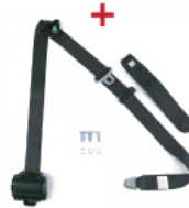
Standarta drošības jostas

Drošības lokam jābūt nostiprinātam pie virsbūves ar skrūvētu vai metinātu savienojumu